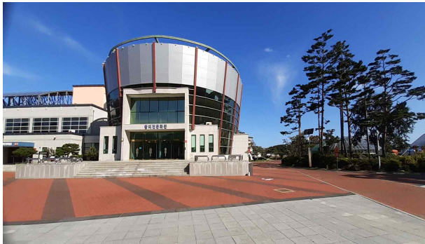
〈위치도 : 왕피천 문화관〉