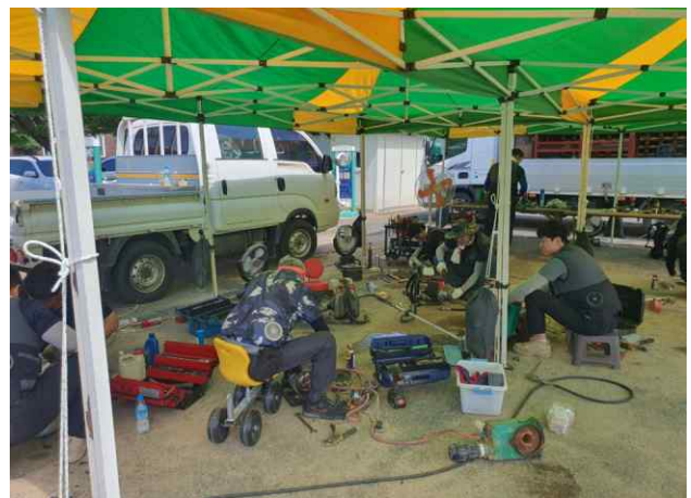
재난 지역 농기계 수리 지원