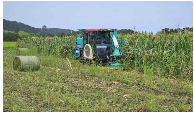
옥수수 수확 작업