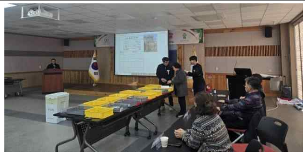
불용 농기계 개찰 현장