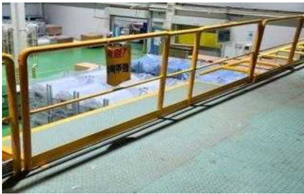
안전난간대 및 발끝막이판