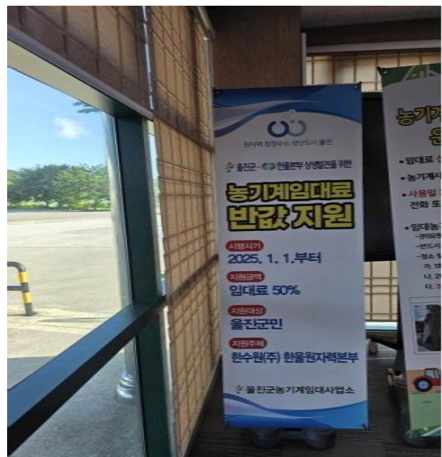
임대료 확대지원 배너