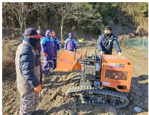
농·산업기계 안전사용 현장 교육