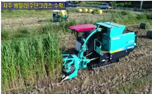
수단그라스 수확 작업

※ 배합사료 구입비 절감효과(*25년기준): 3,990롤X 450kg/롤X 560원/kg(배합사료구입가격)= 1,005백만원