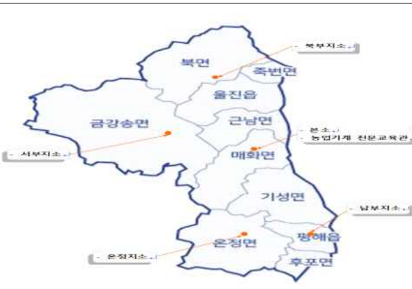
본소 및 지소 위치(5개소)