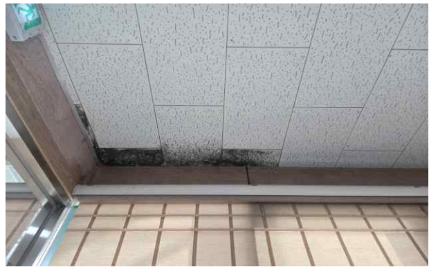
사무실 천장 누수