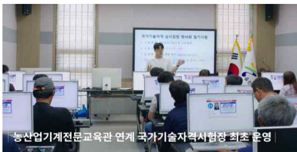
농산업기계전문교육관 연계 국가기술자격시험장 최초 운영