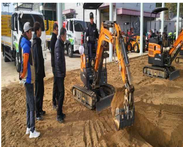
소형건설기계 조종사 면허취득 교육