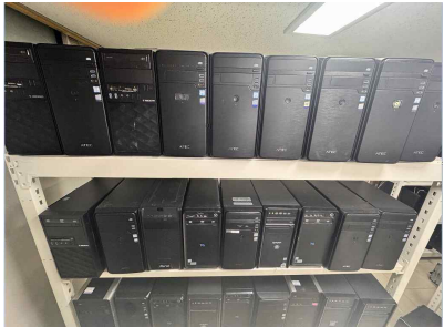
업무용 전산장비 보급