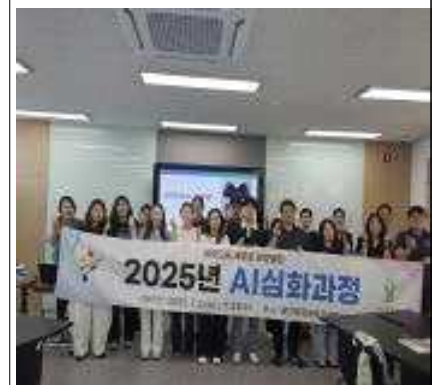
시 심화과정 운영