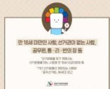
공명선거 추진 지도·감독

'공직선거법' 또는 다른 법률에 의하여 선거운동이 제한되는 사람은 선거운동을 할 수 없어요!