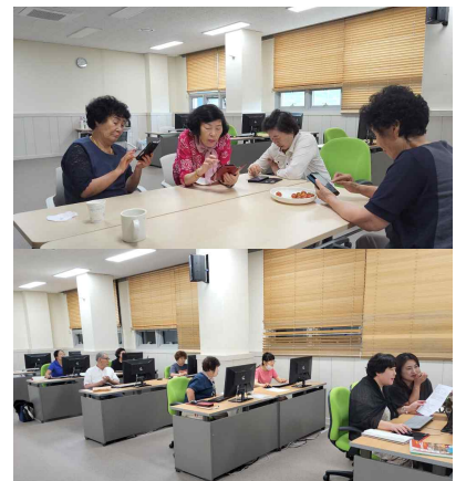
스마트폰, PC사용법 교육