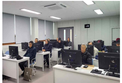
컴퓨터교육장 활용 교육