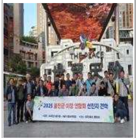
해외 선진지 견학