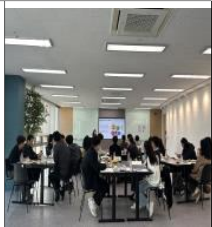
직급별 맞춤형 직무역량강화교육