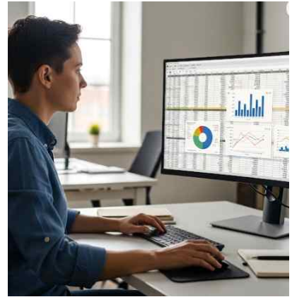
빅데이터 분석 활용