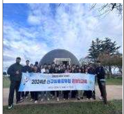
신규임용공무원 공직적응 온보딩교육